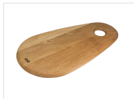
nh 114 a VE 2 75.00 42 x 25 cm, H 2 cm Schneidebrett Teardrop S Planche à découper Teardrop S