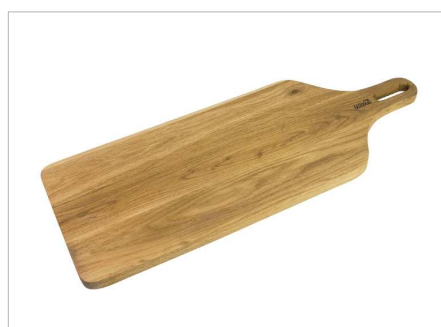
nh 086 VE 2 65.00 39 x 20, H 1.5 cm Schneide-, Servierbrett Paddleboard M Planche à découper, à servir Paddleboard M