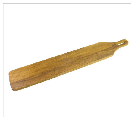
nh 084 VE 2 44.00 67 x 12, H 1.5 cm Schneide-, Servierbrett Paddleboard Long Planche à découper, à servir Paddleboard Long