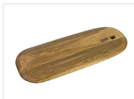
nh 095 VE 2 44.00 38.5 x 16.6, H 2 cm Schneidebrett Surf S Planche à découper Surf S