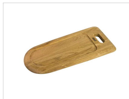
nh 089 VE 2 59.00 40 x 19, H 2 cm Schneide-, Servierbrett mit Safrinne S Planche à découper, à servir avec rigole S