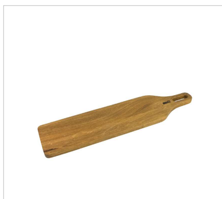
nh 083 VE 2 32.00 50 x 12, H 1.5 cm Schneide-, Servierbrett Paddleboard Short Planche à découper, à servir Paddleboard Short