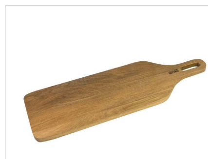
nh 085 VE 2 44.00 34 x 15, H 1.5 cm Schneide-, Servierbrett Paddleboard S Planche à découper, à servir Paddleboard S